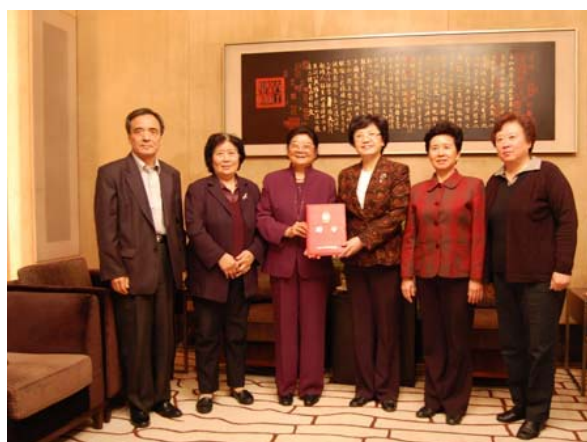
出席仪式领导同顾秀莲副委员长 合影留念

4月12日下午，国家人口和计划生育委员会党组书记、主任李斌将聘书递呈顾秀莲。仪式上中国人口福利基金会理事长赵炳礼向出席的领导简要报告了幸福工程的发展状况。出席仪式的还有国家