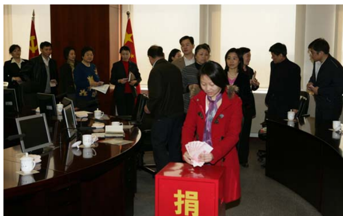
中组部为幸福工程捐款

领下，无论是卧病在床的老校长、老专家，还是来校不久的合同工、农民工，全部参加了捐款。中央党史研究室领导要求干部职工要怀着对灾区贫