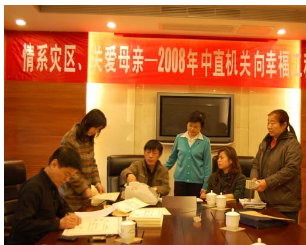
中央直属机关为幸福工程捐款现场

中央直属机关广大干部职工积极响应号召，慷慨解囊，奉献了自己的一份爱心，从部、局级领导到普通职工，从耄耋之年的老人到花季年华的青年，每