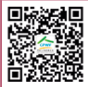
中国人口福利基金会微信