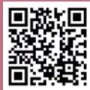
中国人口福利基金会微博