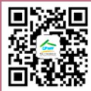
中国人口福利基金会官网