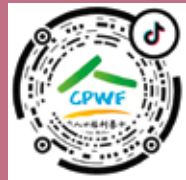
中国人口福利基金会抖音

汇款收款人：中国人口福利基金会 汇款地址：北京市海淀区大慧寺 12 号 2444 信箱 邮编：100081 人民币开户行：中国民生银行北京魏公村支行 账户名称：中国人口福利基金会 人民币账号：0121014410000018 在线捐赠： www.cpwf.org.cn