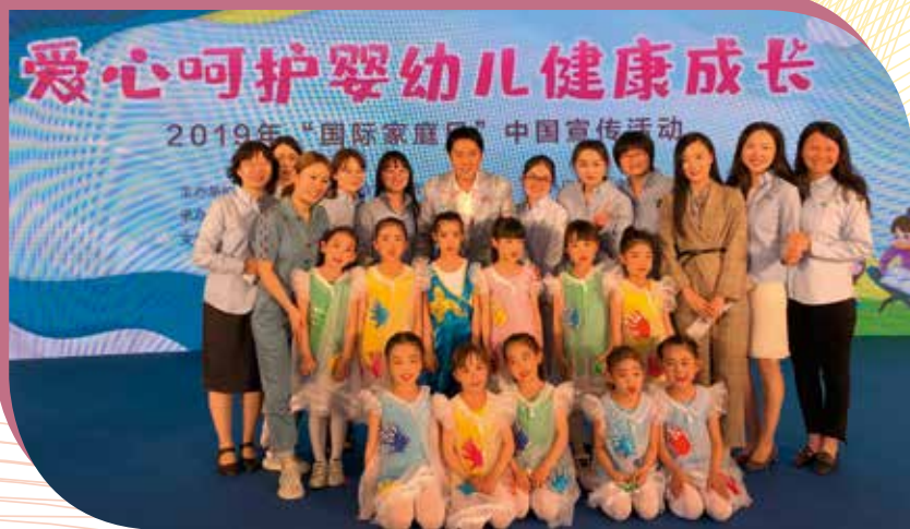
活动现场基金会工作人员与蔡国庆合照