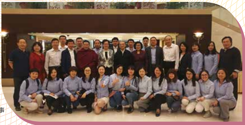
基金会员工与理事会领导合照