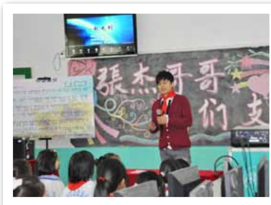
北京朝阳区小武基村弘善农民工子弟学校落成了第一家“张杰音乐梦想教室”