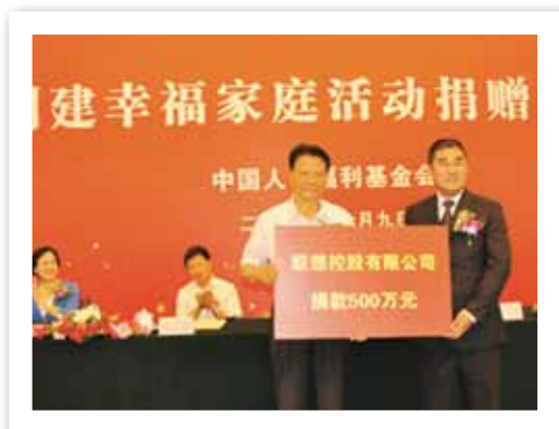
7月9日，王忠禹会长在人民大会堂创建幸福家庭活动捐赠仪式上接受联想控股有限公司捐赠