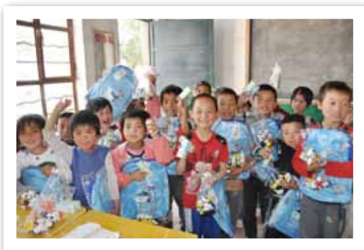
孩子们拿到了崭新的书包，可爱的玩具，还有防止蚊虫叮咬的小药膏

霁霁爱心基金一直致力于向经济相对落后地区的孩子们提供力所能及的帮助。2012年，先后为宁夏隆德县、彭阳县、海原县，内蒙古达茂旗、额尔古纳市，甘肃泾川县，黑龙江嫩江县、克山县、林甸县、海伦市、青冈县，西藏定日县、定结县、聂拉木县、吉隆县等15个县的7525名贫困儿童捐赠书包6139个、课桌椅5525套、玩具公仔5525套、驱蚊产品4000套、羽绒服2000件、围巾2000条、毛衣300件、帽子200顶，为边远地区的孩子们送去了关爱和温暖。