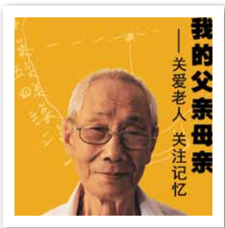
我的父亲母亲——黄手环行动宣传折页

9 月初，公益行动在我国几大门户网站上发起以消除社会歧视、增进社会了解为目的的“为爱更名”活动。134 万网友参与投票，推动卫生部医学名词审定委员会启动为痴呆