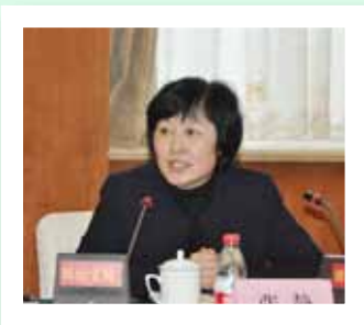
全国妇联书记处书记张静出席会议