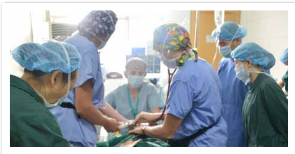
外国专家的精湛医术不仅给患儿带来微笑，还传递了爱心和友谊

中央电视台“朝闻天下”、“中文国际”等栏目对“幸福微笑”进行了多次报道。还利用新媒体平台，开展网络宣传和网上筹款。2012年10月的“幸福微笑——救助唇腭裂儿童”专题公益平台，通过新浪官方微博及时发布活动信息，得到了网友的积极响应，单条微博转发上千次。