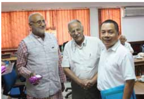
财务资产部副部长邢军赴印度参加人口发展战略和非政府组织发展培训班。图为与生殖健康促进组织工作人员交谈