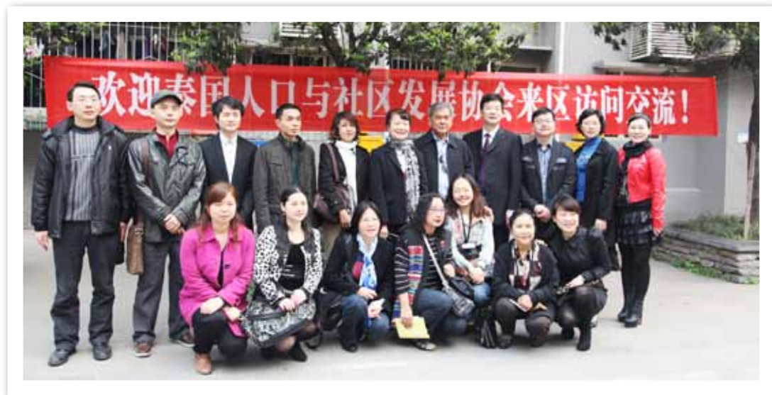
我会组织泰国人口与社区发展协会赴重庆交流考察