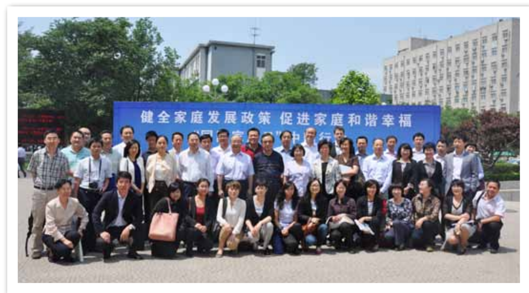
5月14日，“健全家庭发展政策，促进家庭和谐幸福——‘国际家庭日’中国行动”在中国人民大学逸夫会议中心举行

我会在南京国际人口培训中心成功举办了三期试点市培训班，取得了良好效果。我会领导在中央党校举办的试点市分管市长专题研究班以及部分省市举办的培训班或（专题论坛）上，积极宣讲创建活动，起到了倡导、指导和督导的作用。