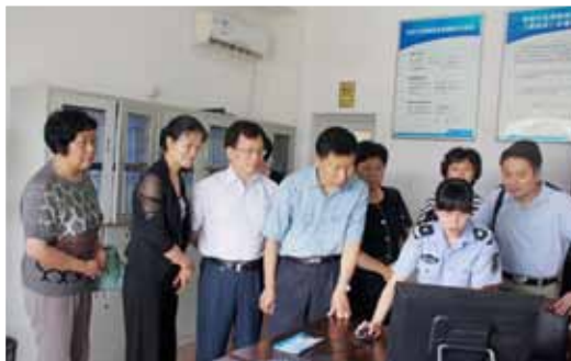
中国计划生育协会党组书记、常务副会长杨玉学考察长沙市天心区青园街道友谊小区网格人口综合管理服务站