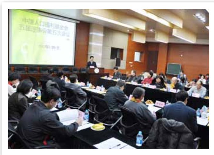
中国人口福利基金会五届理事会第五次会议现场