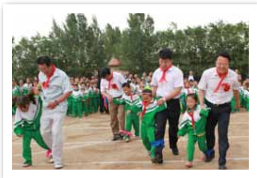
在内蒙古捐赠仪式上，与会领导和孩子们搭档配合，做起了互动游戏