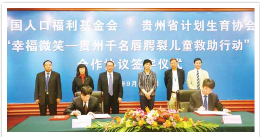
国家人口和计划生育委员会崔丽主任、贵州省副省长谢庆生出席“幸福微笑——贵州千名唇腭裂儿童救助行动”签字仪式

2012年5月，“幸福微笑”首次来到贵州。有关数据显示，截止2010年底，该省尚有1260余名唇腭裂儿童尚未接受任何治疗。对此，“幸福微笑”决定驻足贵州，开展为期四年的系统救助。计划到2015年末，为登记在册千余名唇腭裂患儿提供免费手术，并在有条件的医院建立唇腭裂治疗中心。