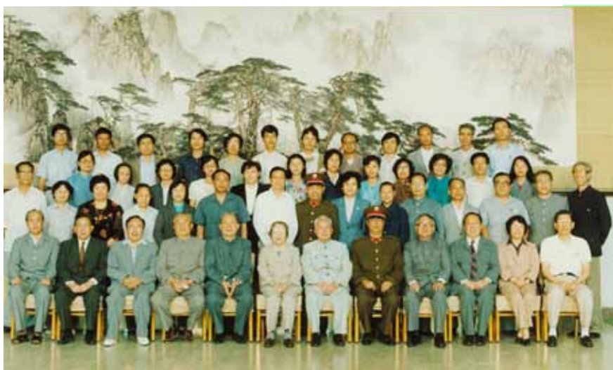
1987年6月10日，中国人口福利基金会成立留影（中南海西花厅）