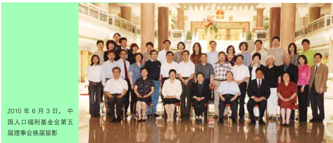
2010年6月3日，中国人口福利基金会第五届理事会换届留影