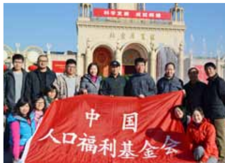
我会干部员工参观学习“科学发展 成就辉煌”大型图片展览合影