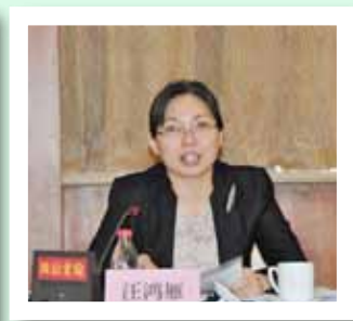
共青团中央书记处书记汪鸿雁出席会议