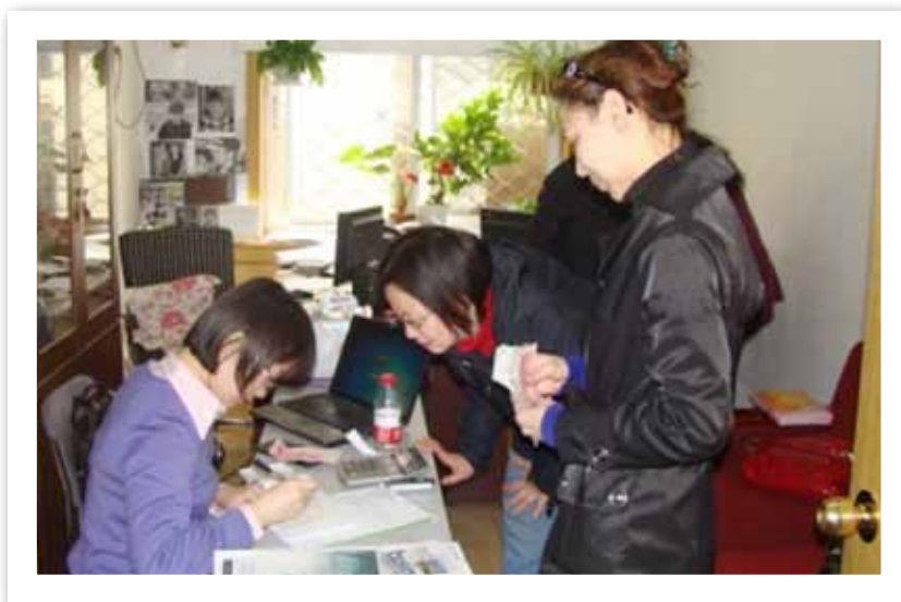
中关村地区单位向中国人口福利基金会递交捐赠支票