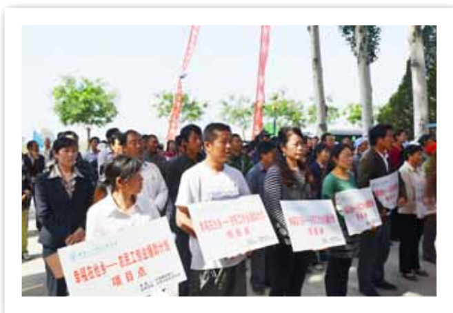
幸福在他乡——农民工创业援助计划宁夏银川启动仪式

2012年，我会和中国建设银行联合开展了“幸福在他乡——农民工创业援助计划”。5月29日，在宁夏银川举办“农民工创业援助”启动仪式，对银川首批54户受助农民工实施了援助；8月28日，向宁波首批受助农民工发放援助款。此外，农民工创业援助计划之月嫂项目顺利实施，专业