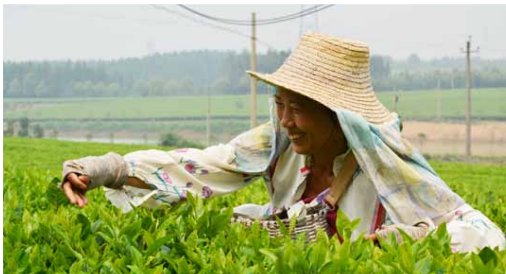
受助母亲从事生产劳动

2012年，幸福工程得到社会各界更多的关注。“母亲节”期间，两大机关百余个百分点张贴了幸福工程宣传海报，新浪网转载了幸福工程文章。“国际消贫日”当天，中央七套《聚焦三农》栏目播出了幸福工程专题节目，讲述了新疆兵团受助母亲侯