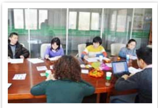
参与反家暴网络“反对家庭暴力、建设性别平等和谐的家庭与社会”培训活动

通过委托执行项目、财务监管和评估、信息共享机制的建立，积极支持一些运作规范、专业性强、具有发展潜力的草根 NGO 组织的发展。