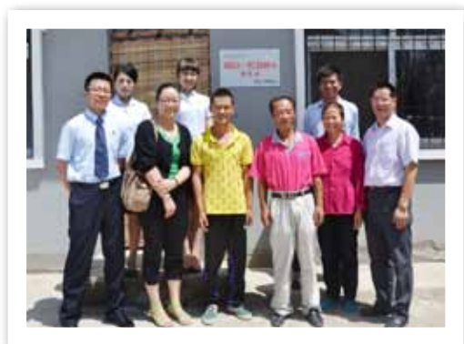
中国建设银行、志愿者和媒体组成爱心团队共同回访宁夏受助户