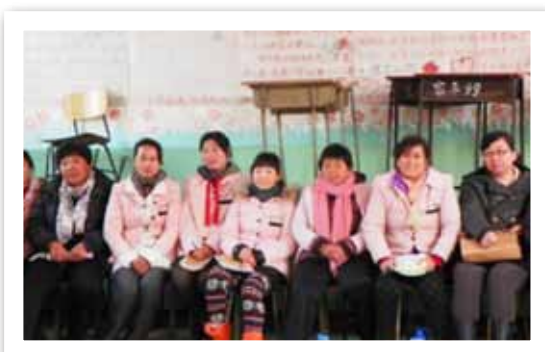
组织中国艾滋病病毒携带者联盟、红树林支持组织与反家暴网络召开工作交流会