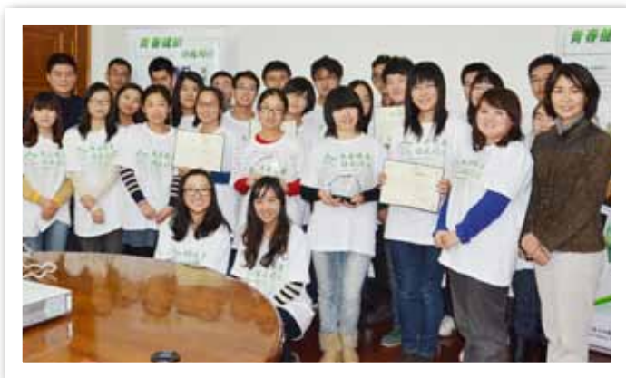
高校活动总结评估大会合影

2012年5月24日，“青春健康 你我同行”启动仪式在江苏省淮安市江苏财经职业技术学院礼堂正式拉开帷幕。先后在全国11座城市37所高校社团开展了志愿者招募、技术支持小组组建、骨干培训、同伴教育主持人培训、同伴教育等校园活动，其中30多个社团报名参与