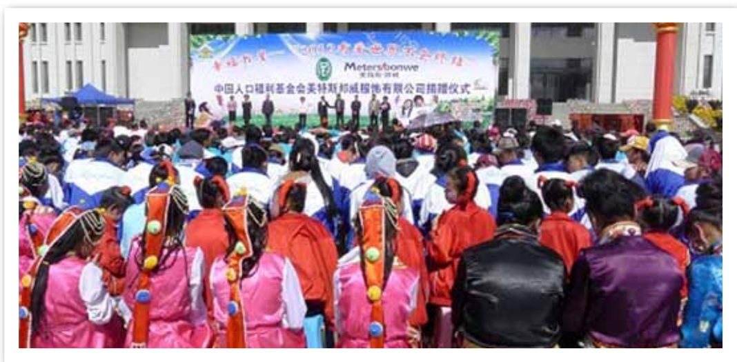
5 月 8 日，我会联合美特斯邦威服饰有限公司在格尔木市中心广场举行捐赠启动仪式

2012 年初，我会广泛征求并采纳网友意见，将“幸福书屋”捐赠由图书扩大到衣物、奶粉等物品，用以改善贫困地区青少年的生活水平。2 月份，我会和美特斯邦威服饰有限公司签署了捐赠协议（2012-2016），总价值人民币 500 万元。将首批价值 100 万元的衣物捐赠给青海格尔木 11 所学校。捐赠物资包括上衣、裤子、鞋子和书包等共计 7350 件。