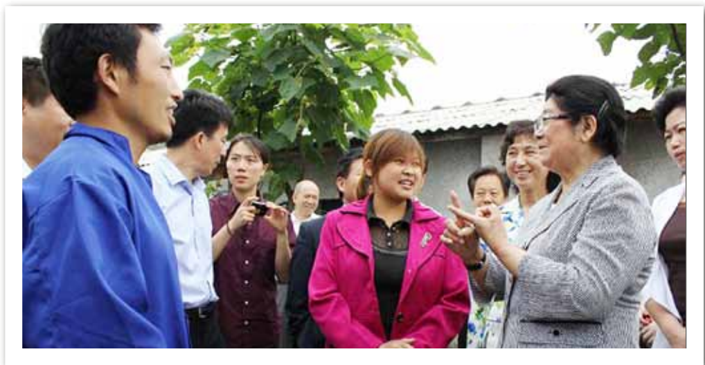
顾秀莲主任视察湖北省咸宁市幸福工程项目

银花的感人故事以及幸福工程组委会主任顾秀莲的采访。在刘亭副理事长、北京市台球协会等爱心单位（个人）的支持下，幸福工程面向特定群体开展了宣传筹款活动。淘宝网、新浪微公益等网络手段的运用，加大了幸福工程在网民中的知名度和美誉度。