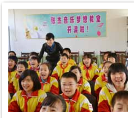
“张杰音乐梦想教室”在天津蓟县天平庄小学落成

2012年7月13日，著名歌手张杰个人出资200万元人民币设立北斗星空爱心基金，以关注青少年文化教育、促进其健康快乐成长为宗旨。发挥演艺明星个人的社会影响力，通过微博联动发起募捐活动，积极筹划“张杰音乐梦想教室”。项目内容包括捐赠价值3万元的音乐器材及相应的配套设备，并由张杰本人为孩子们上一堂音乐课。截止12月底，“张杰音乐梦想教室”已在北京朝阳区小武基村弘善农民工子弟学校、内蒙古呼和浩特市八一路小学、四川省巴中市南疆小学、天津蓟县天平庄小学、深圳市宝安区为民小学先后落成。12月16日，张杰在凯德晶品购物中心举行爱心签售活动，筹集来的善款184200元全部用于捐助贵州山区贫困儿童重返校园。