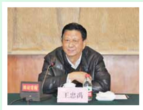
王忠禹会长出席全国创建幸福家庭活动指导委员会第一次全体会议并讲话

2012年初，“一委两会”协调中宣部、发改委、财政部、卫生部、共青团中央、全国妇联、中国红十字会等部委，成立了全国创建幸福家庭活动指导委员会。中国人口福利基金会作为指委会办公室，积极承担并履行综合协调等具体职责。2月7日，召开了指委会第一次全体会议，通报创建幸福家庭活动进展情况，对全年工作做了安排部署；3月30-31日，召开了创建幸福家庭活动试点推进工作座谈会，深入学习贯彻全国“两会”和国家人口计生委2012年工作要点精神；8月12-13日，在大连市召开了创建幸福家庭活动试点市人口计生委主任座谈会，总结交流试点市创建活动经验；9月24-25日，在浙江省宁波市召开了全国创建幸福家庭活动经验交流会议，总结工作，考察现场，扩大试点，安排部署下步任务，推动全国创建幸福家庭活动持续健康开展。