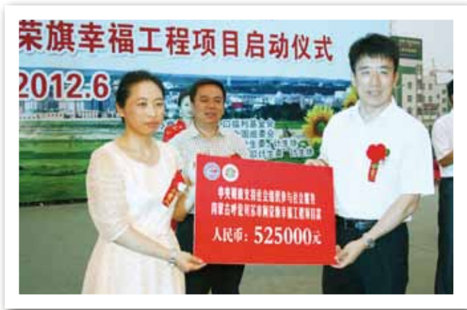
幸福工程中央财政项目在阿荣旗启动

2012年，幸福工程项目管理更加规范、成熟。成功举办了华北片、西北片幸福工程管理人员培训班，来自13个省（区、市）的幸福工程各级项目人员300余人接受了系统培训。幸福工程全国组委会制定和完善了幸福工程《工作手册》、《项目申报书》和《评估报告书》等范本。同时，加大项目的监督管理力度，对部分项目点进行了电话或实地抽样调查。12月底，在人基会官网和幸福工程子网站首次实行幸福工程项目招标，打造从项目设立、项目执行到监督管理等各个环节全透明公益项目。在国务院扶贫办下发《关于社会扶贫创新案例评选情况的通报》中，“幸福工程——救助贫困母亲行动”成为100个入选的社会扶贫创新案例之一。