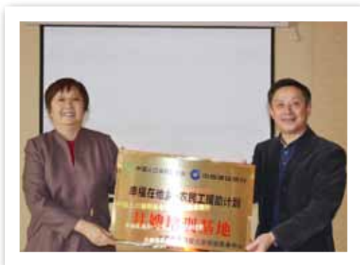
蓝野副秘书长为月嫂培训基地授牌

10月26日为第九届“你在他乡还好吗”流动人口公益活动日，我会在北京西站将北京纺达科技公司捐赠的价值2.8万元的服装发放给广大流动人口。