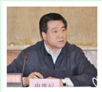
中共中央宣传部副部长申维辰出席会议