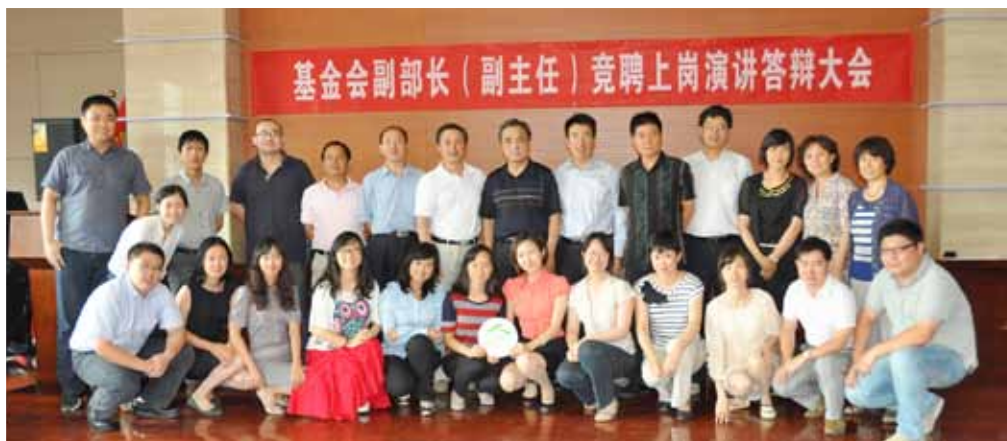
我会副部长（副主任）竞聘上岗演讲答辩大会合影

2012年我会通过社会招聘新增员工6人，使在职工作人员达到26人，有博士、硕士和出国留学经历的占员工总数的1/3以上。开展学习型组织建设，通过“读讲一本书”、观看《人民的好儿女》系列片、参观科学发展大型展览、座谈研讨、学习征文等形式，增强工作人员的学习自觉性。探索建立鼓励竞争，优胜劣汰的选人用人机制，组织了部门副职竞聘上岗工作，两位年轻同志脱颖而出，分别被任命为国内发展部和项目管理部的副部长。扎实开展“双创双争”和“走出机关、服务基层”活动，为帮扶点提供了30多万元物资和资金，帮助当地贫困家庭发展致富；及时到遭受“7·21”暴雨灾害的北京房山地区救灾慰问，增强了员工勇于担当、乐于奉献的意识。