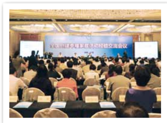
9月24日至25日，全国创建幸福家庭活动经验交流会议在浙江省宁波市召开