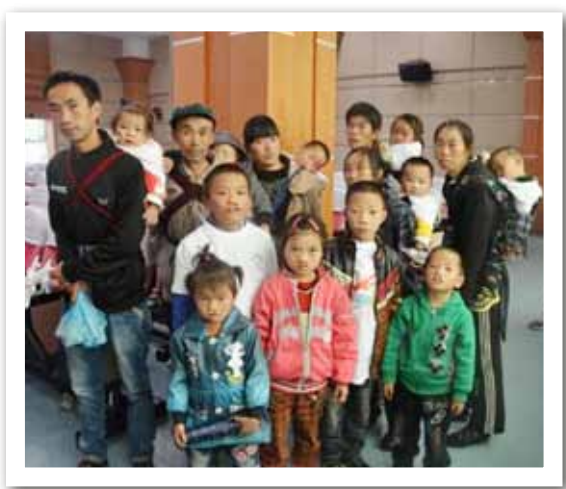
在贵州，有上千名儿童因为家庭贫困而错过了最佳治疗时间

9月17日，“幸福微笑——贵州省千名唇腭裂儿童救助行动”签字仪式在贵阳举行，国家人口和计划生育委员会副主任崔丽、贵州省副省长谢庆生出席并给予了高度评价。认为这样的救助行动是“幸福微笑”项目组织管理的创新，把省级计划生育协会纳入固定合作伙伴，更大程度地整合了社会资源，由此前的“游击式”，改变为定点、长期、系统的救助模式，在为患儿提供手术的同时，还能够切实带动当地医疗技术的发展。