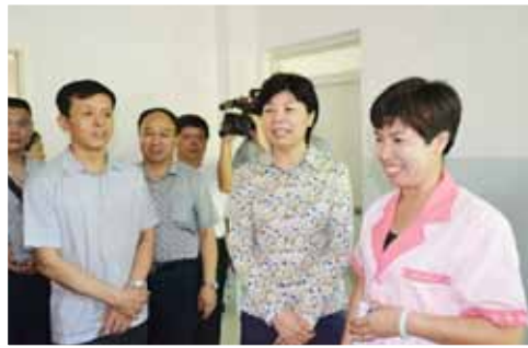
崔丽副主任带队考察河北省廊坊市永清县人口与计划生育服务中心

3月18-20日，王忠禹会长率队到浙江省考察创建幸福家庭活动，了解工作进展，听取意见建议，进一步研究推动创建活动试点工作。6月中旬到7月上旬，“一委两会”抽调人员组成4支调研组，国家人口计生委副主任崔丽、中国计划生育协会常务副会长杨玉学、以及赵炳礼理事长等领导带队，先后到河北廊坊、湖南长沙、安徽铜陵、江西新余、湖北武汉、甘肃酒泉、贵州遵义、内蒙古包头、吉林长春等试点市展开调研并形成报告，在国家人口计生委第79次主任会议上作了专题汇报，得到王侠主任等委领导和有关司局负责同志的一致肯定。