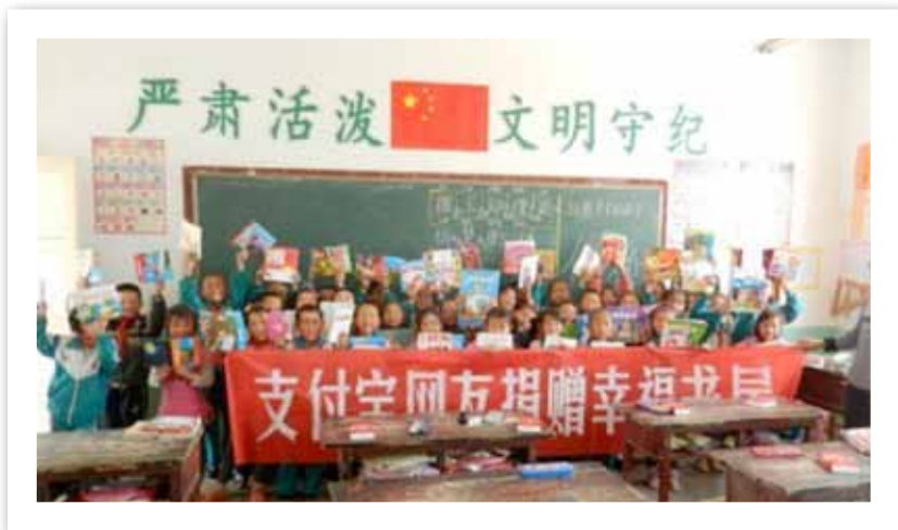
伍仲小学幸福书屋活动现场

8月3日，我会全透明网络慈善活动“2012有爱，世界不会终结”网络募捐平台正式上线。作为“幸福书屋，爱自2010”的延续和升级，发出“送别人一份福气，给自己一份运气”的快乐慈善倡议，将网络透明慈善概念进一步推广，鼓励全民投身快乐慈善，激励一代人用知识改变命运。经十万网友许愿墙投票确定为山东沂南革命老区、河南上蔡受艾滋影响家庭、湖北秭归三峡移民、湖南沅陵留守儿童及宁夏海原少数民族五个地区送去图书与关爱。截止12月底，幸福书屋官网共收到网友捐款133155.16元，并通过新浪微公益募款18849元。