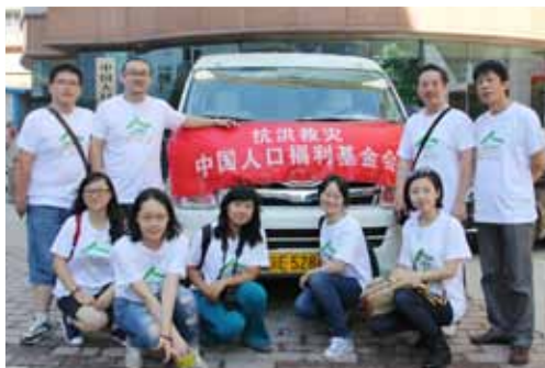
我会年轻同志自发组织到遭受“7·21”暴雨灾害的北京房山地区救灾慰问