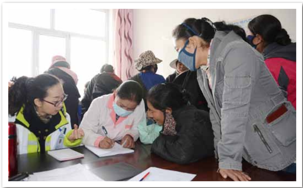
生殖健康援助行动为青海省玉树州囊谦县育龄妇女进行义诊

作为我会创建幸福家庭活动重要载体之一，2012 年生殖健康援助行动为甘肃省、青海玉树州、宁夏吴忠市、湖北武汉市等 14 个市及下属县、乡了捐赠 1418 台医用综合蓝氧治疗仪，受到当地育龄群众的欢迎。杭州市拱墅区计划生育指导站通过开展“健康母亲 幸福家庭”惠民工程项目，在常住育龄妇女中开展高质量的生殖健康检查治疗，已惠及全区一万余人次，各种生殖道感染治疗综合有效率为 92%，群众可接受度为 96%、满意率为 98%。